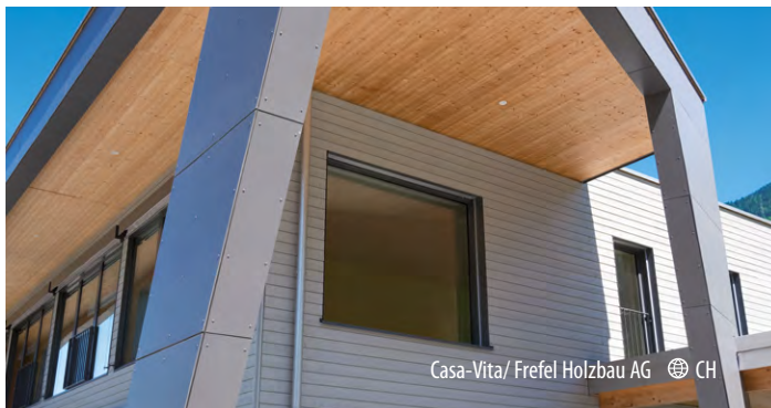
Casa-Vita/ Frefel Holzbau AG CH

Producent: AGROP NOVA a.s. Ptenský Dvorek 99 • 798 43 Ptení • Republika Czeska novatop-swp@agrop.cz • www.novatop-swp.pl