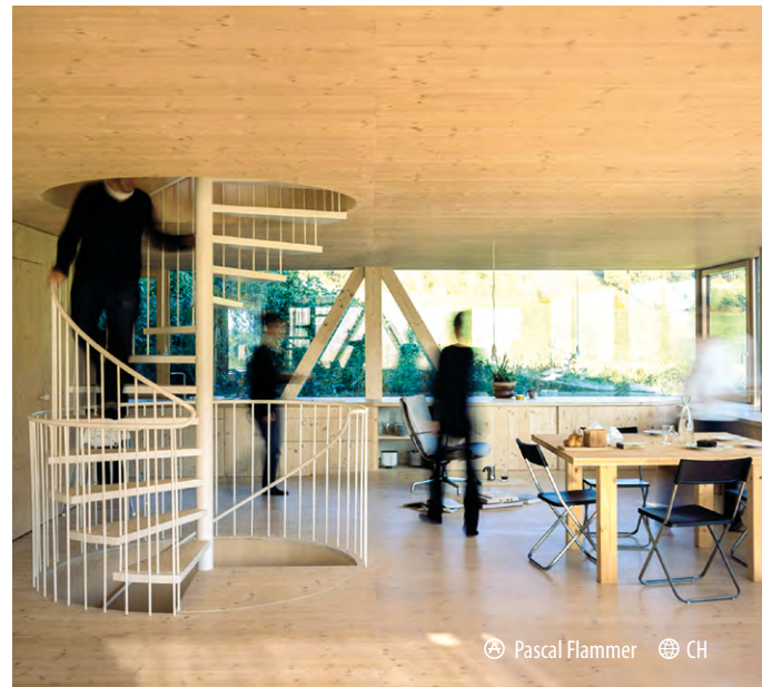
Pascal Flammer CH