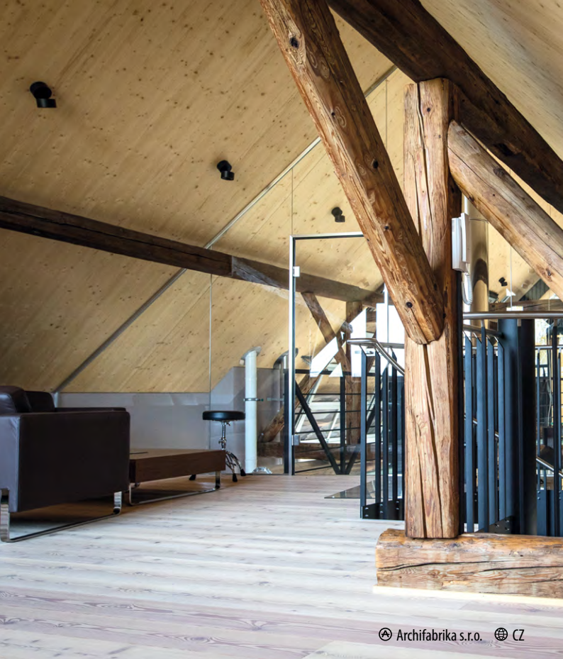
Archifabrika s.r.o. CZ